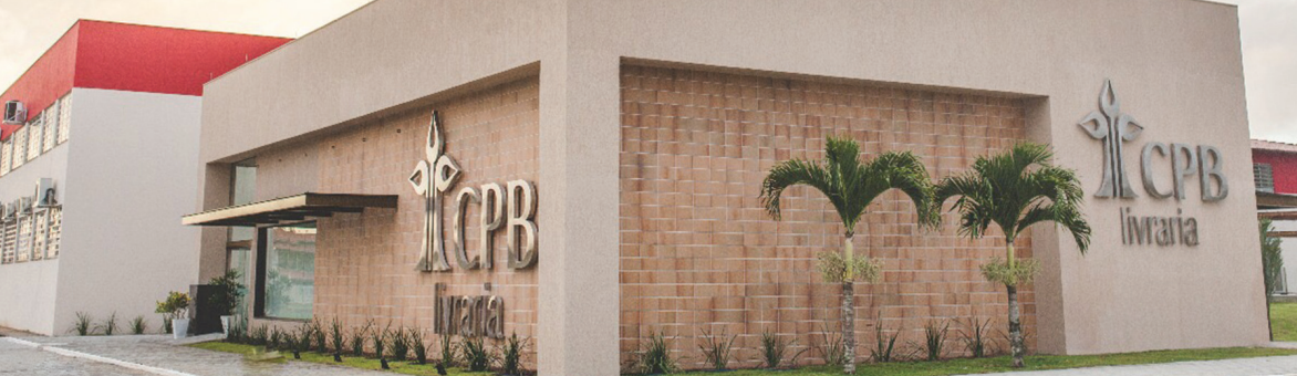
FADBA – CACHOEIRA, BA