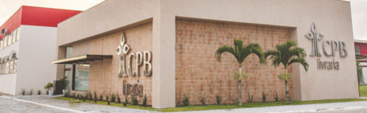
FADBA – CACHOEIRA, BA